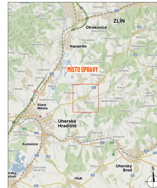
DETAIL MÍSTA ÚPRAVY