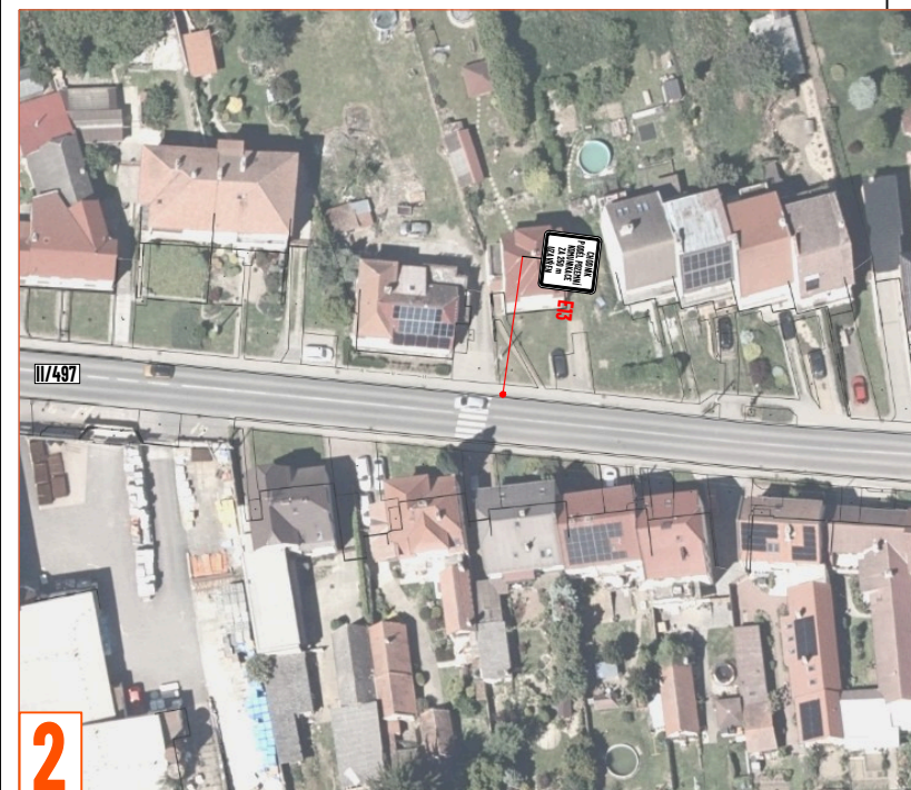
2 PRACOVNÍ MÍSTO - PO PRACOVNÍ DOBĚ